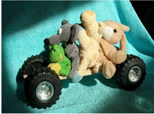
Downhill – Mono - Skate